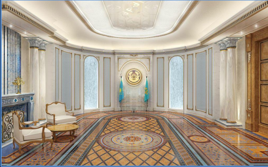
Bakü – Cumhurbaşkanlığı Oval Ofis Detayı